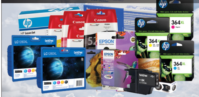
Tonere og blekk